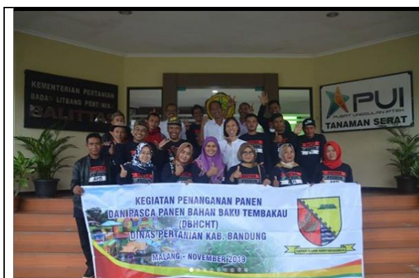
Gambar 6. Kunjungan Kerjasama Dinas Perkebunan Kabupaten Bandung

Berikut ini adalah dokumentasi beberapa kegiatan pelayanan informasi tatap muka.