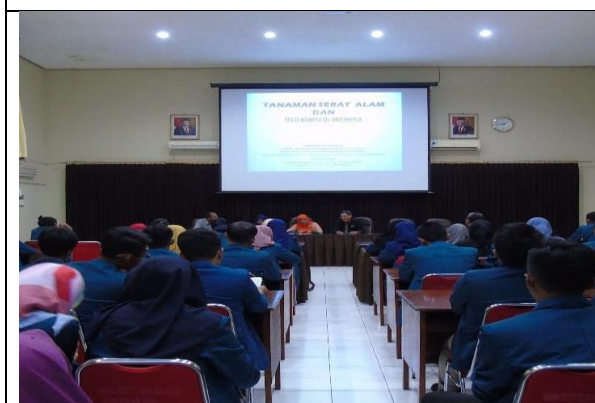
Gambar 8. Pelayanan Kunjungan mahasiswa dan Dosen Fak. Peternakan dan Pertanian UNDIP . Semarang