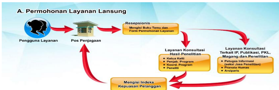
Gambar 1. Alur permohonan layanan langsung

Pelayanan informasi di balitas ada 2 macam yaitu permohonan layanan langsung dan permohonan layanan tidak langsung. Alur layanan informasi publik di Balittas adalah sebagai berikut :