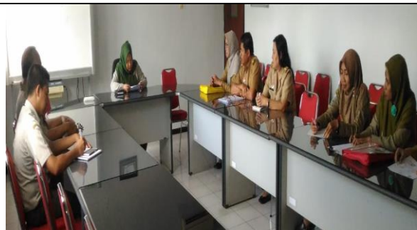
Gambar 14. Pelayanan Kunjungan Inspektorat Pemerintah Propinsi Jawa Timur dan BBPPTP Surabaya