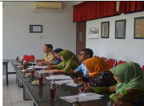
Gambar 13. Konsolidasi dan Koordinasi Kerjasama Pelepasan Varietas Tembakau Lokal Pemda dan Dinas Pertanian dan Pangan Kab. Kendal