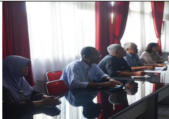
Gambar 12. Pelayanan kunjungan Pemda dan Dinas Pertanian dan Pangan Kab. Kendal