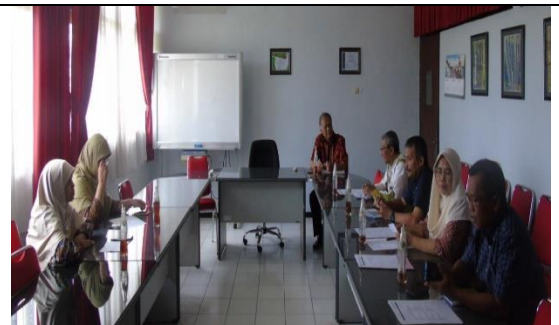
Gambar 15. Pelayanan Kunjungan Dinas Pertanian dan Pangan Kab. Tulungagung