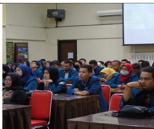
Gambar 9. Kunjungan mahasiswa dan Dosen Fak. Peternakan dan Pertanian UNDIP . Semarang