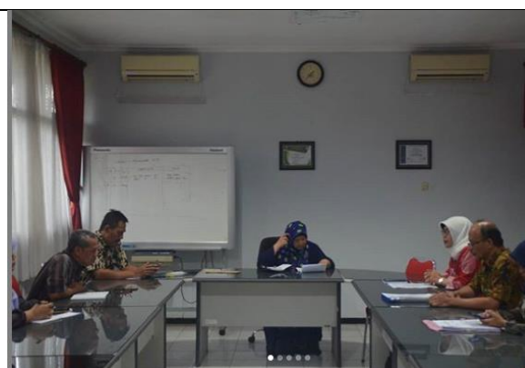
Gambar 7. Kunjungan Dinas Perkebunan Propinsi Jawa Timur