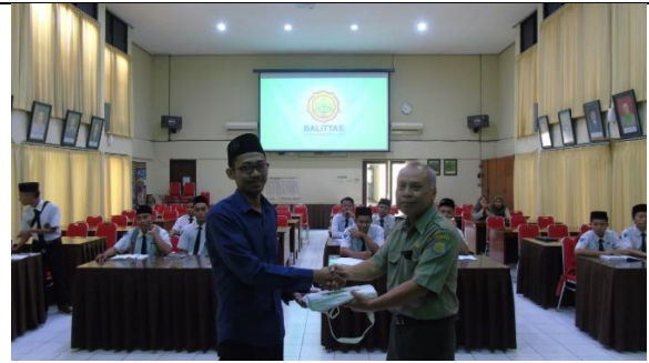
Gambar 11. Penyerahan Cenderamata Madrasah Nurul Jadid Probolinggo