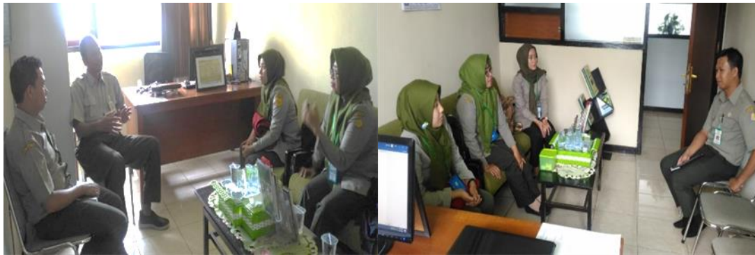
Gambar 5. Ruang layanan informasi

Pada layanan langsung secara tatap muka, PPID Balittas menetapkan standar layanan informasi dalam rangka penyelenggaraan layanan publik yang baik dengan menyediakan sarana, prasarana, dan fasilitas diantaranya berupa desk layanan informasi dan fasilitas pendukung seperti layanan akses internet gratis, produk layanan serta menetapkan waktu layanan informasi.