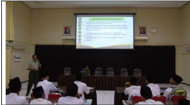
Gambar 10. Pelayanan Kunjungan Madrasah Nurul Jadid Probolinggo