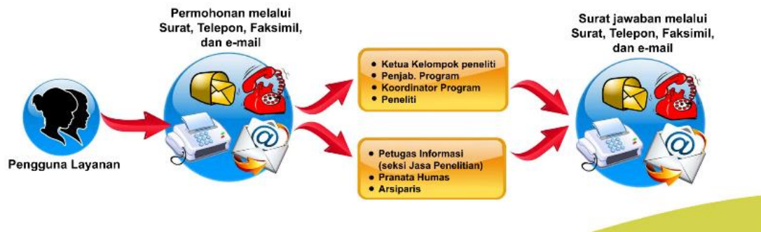
Gambar 2. Alur Permohonan Layanan Tidak Langsung

Pelayanan sidado merupakan jenis layanan yang menampilkan dokumen-dokumen yang dimiliki oleh masing-masing UPT. Adapun dokumen yang ditampilkan diantaranya :