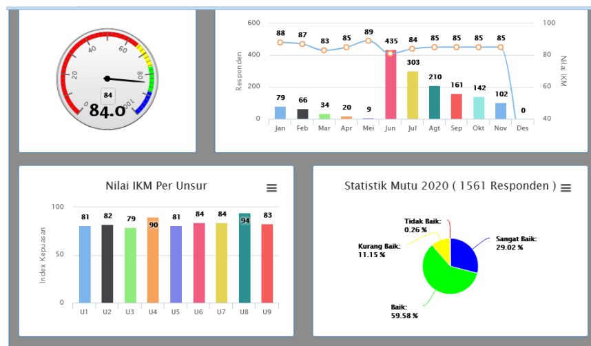
Gambar 17. IKM Semester II

Dari hasil pengukuran di atas, dihasilkan data nilai IKM 85,16 dengan nilai mutu pelayanan adalah B dan kinerja unit pelayanan nilainya adalah BAIK. Berdasarkan pengukuran IKM, pelayanan Balittas kepada pelanggan secara keseluruhan dinilai BAIK.